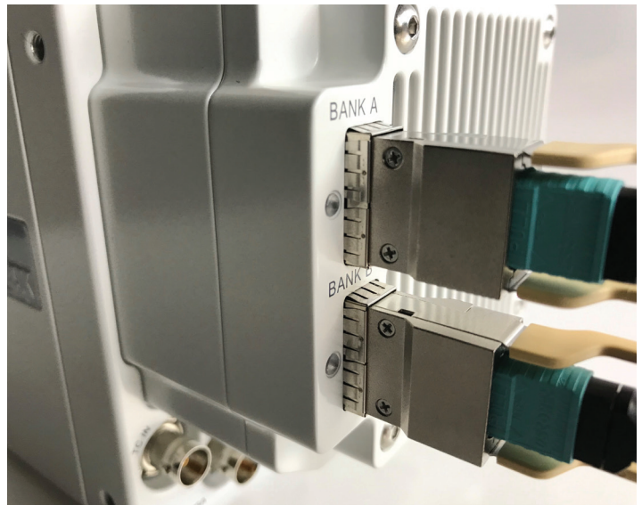
Phantom S641 接上线缆