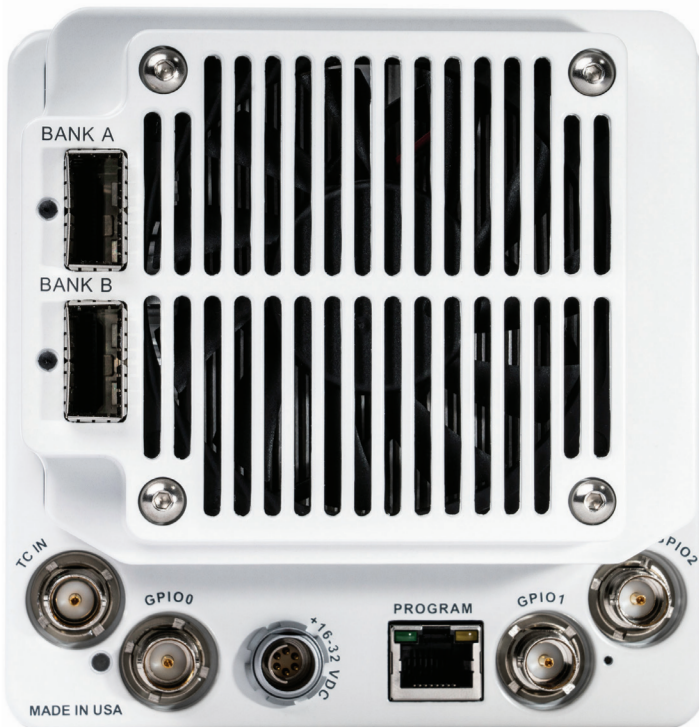
Phantom S641 接口